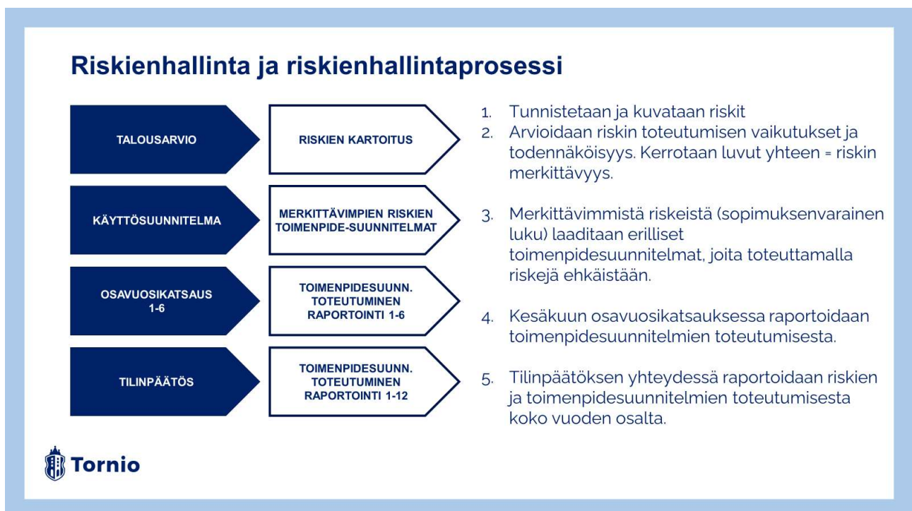
Kuvio 1. Riskienhallinta ja riskienhallintaprosessi.

Tornion kaupungin riskienhallinta ja riskienhallintaprosessi on kuvattu sisäisen valvonnan ja riskienhallinnan ohjeessa.