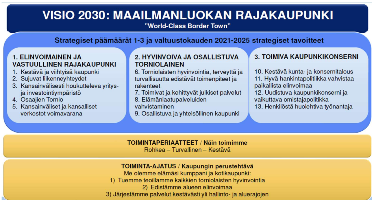
Kuvio 2. Tornion kaupunkistrategian tiivistelmä.

Tornion kaupunkistrategia on ladattavissa kokonaisuudessaan kaupungin verkkosivuilta: https://www.tornio.fi/kaupunki-ja-hallinto/talous-ja-strategiat/kaupunkistrategia/