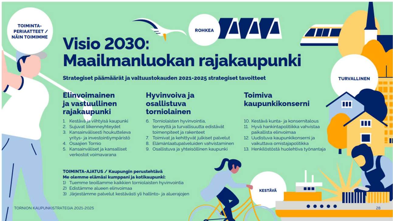
Kuvio 1. Valtuustokauden 2021–2025 strategiset tavoitteet ja toimenpiteet.

Tornion kaupunginvaltuuston 26.2.2018 § 18 hyväksymässä kaupunkistrategiassa on määritellyt omistajapolitiittisia tavoitteita seuraavasti: