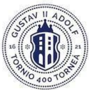
Tornion juhluvuoden logo

Opetuksen järjestäjä pitää huolta siitä, että opetushenkilöstö tuntee perusopetuslain tukea koskevat säädökset sekä osaa toimia Esiopetuksen perusteet 2014 mukaisten tuen määräysten ja paikallisesti sovittujen käytäntöjen mukaisesti.