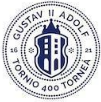
Tornion juhlavuoden logo

Monialainen oppilashuollon yhteistyötä teemme opetustoimen ja sosiaali- ja terveystoimen kanssa. Lapsen ja hänen huoltajansa kanssa yhteistyötä teemme huomioiden lapsenikä ja edellytykset. Pidämme oppilashuollon painopisteen ehkäisevässä ja yhteisöllisessä työkentelyssä.