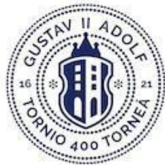
Tornion juhluvuoden logo