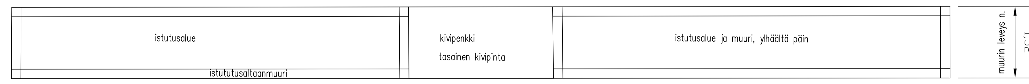
PERIAATEKUVA, ISTUTUSALLAS/MUURI JA KIVIPENKKI 1:50