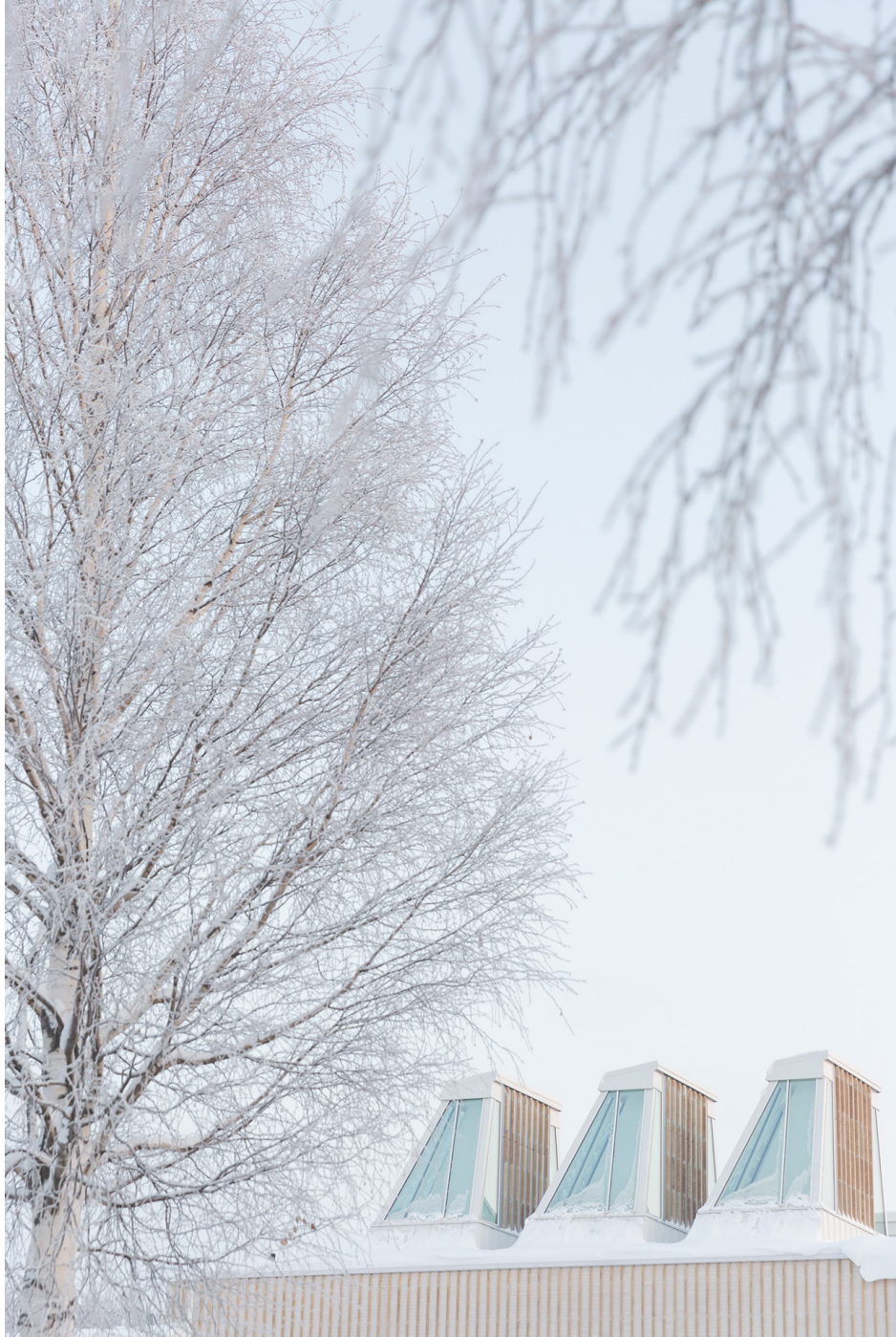
Aineen taidemuseo Kuva: Eija Mäki vuoti