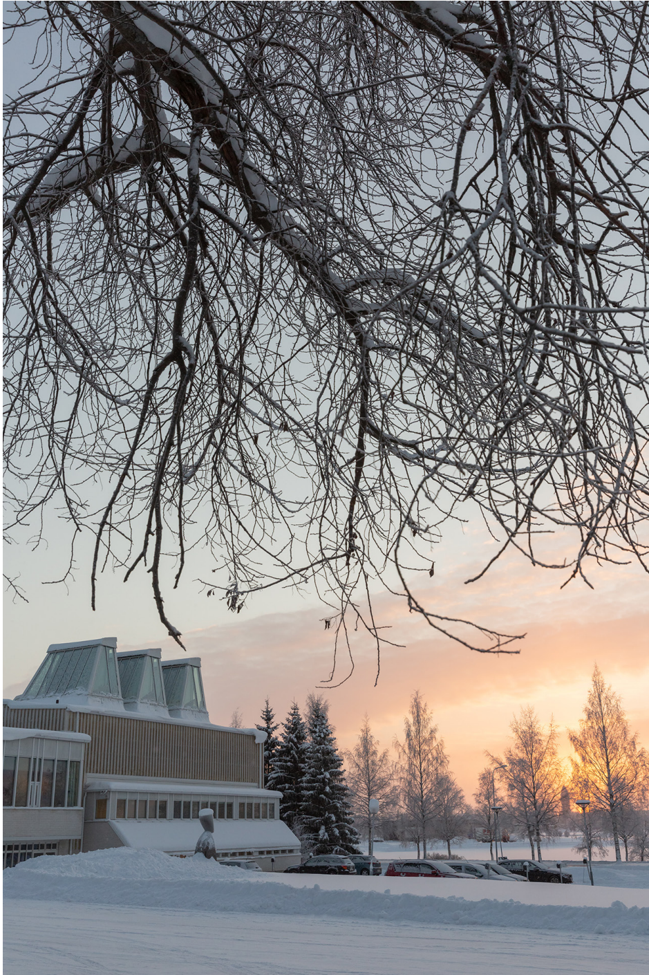
Aineen taidemuseo.