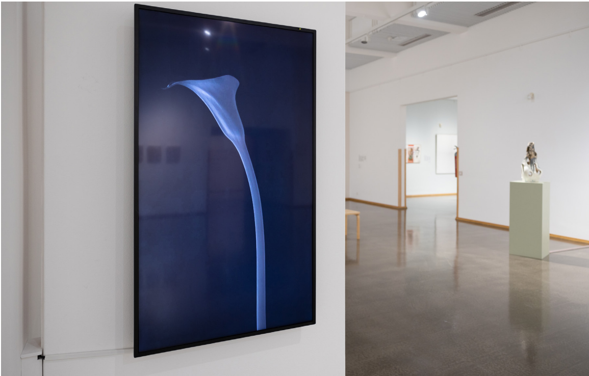
Kokoelmanäyttely Mitäs täällä tapahtuu?