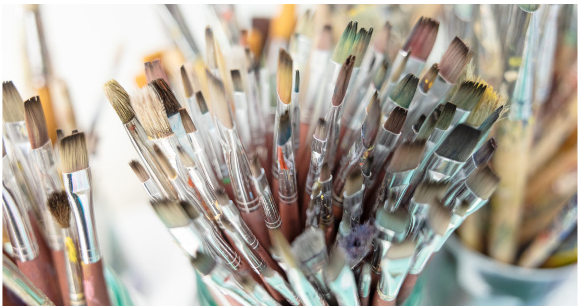
Kuva: Eija Mäki vuoti, 2023

Taidetyöpajat mahdollistavat osallisuuden ja niiden avulla näyttelyssä koettua pääsee itse tekemään. Työpajoissa käytetään taiteen eri menetelmiä. Työpajat ja opastukset soveltuvat kaikille.