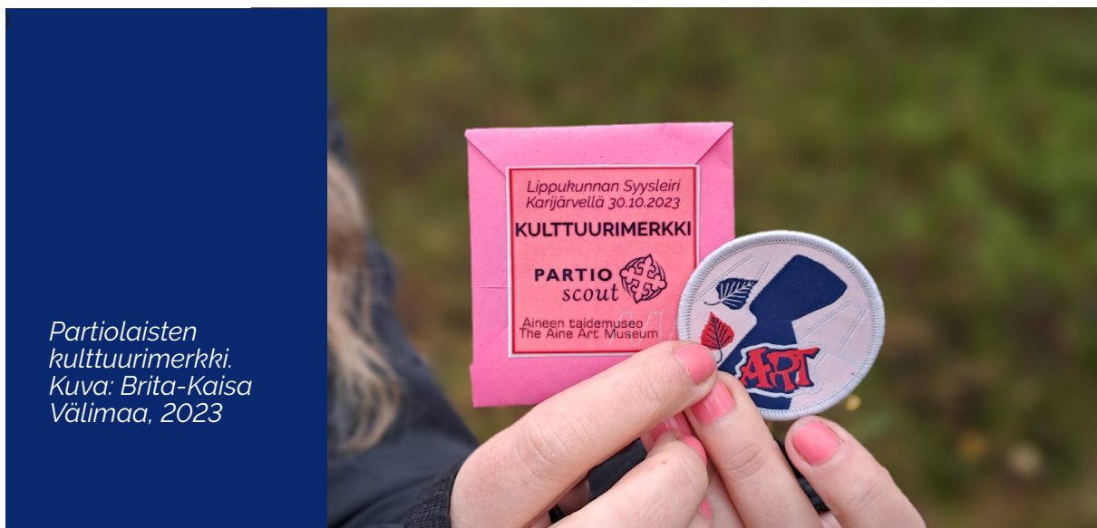
Partiolaisten kulttuurimerkki. Kuva: Brita-Kaisa Välimaa, 2023

Aineen taidemuseo oli vuonna 2023 mukana lukuisissa yhteistapahtumissa, joita järjestivät mm. Tornion seurakunta, Asunnottomien yö, YLE Pikku Kakkonen ja Tornion partio. Aineen taidemuseo on tehnyt useana vuonna yhteistyötä Tornion partion Pohjan Tytöt ja Sissit ry:n kanssa. Partiolaiset järjestivät syysleirin Karijärvellä 30.9., jossa museoassistentti vierailivat pitämässä taidetyöpajoja. Aineen taidemuseo on suunnitellut partiolle kulttuurimerkin.