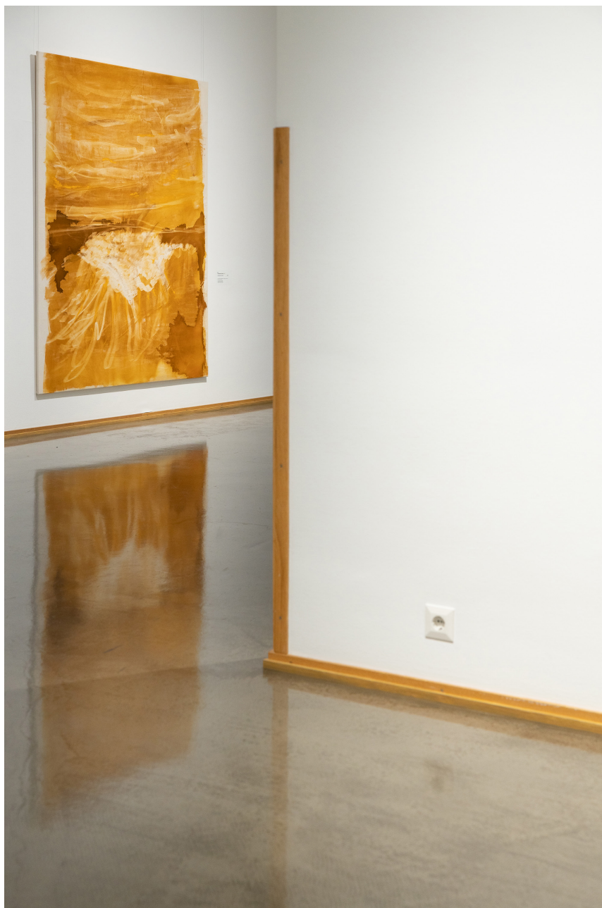
Mitäs täällä tapahtuu? kokoelmanäyttely. Kuva: Eija Mäki vuoti, 2023

Kansainvälinen museoneuvosto (International Council of Museums) ICOM Taideneuvosto (museonjohtaja jäsen 2022–2025) Suomen museoliitto - Finlands museiförbund ry Lapin lastenkulttuuriverkosto