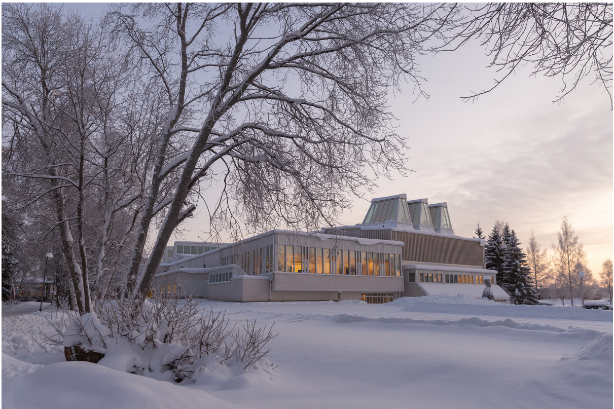
Aineen taidemuseo Kuva: Eija Mäki vuoti

Aineen taidemuseossa työskentelee vakituisesti amanuenssi, näyttelymestari, museoassistentti, museolehtori, museomestari ja museonjohtaja. Taidemuseossa suorittaa vuosittain harjoitteluja, työhön tutustumisia ja -kokeiluja lukuisa joukko määräaikaista henkilökuntaa.