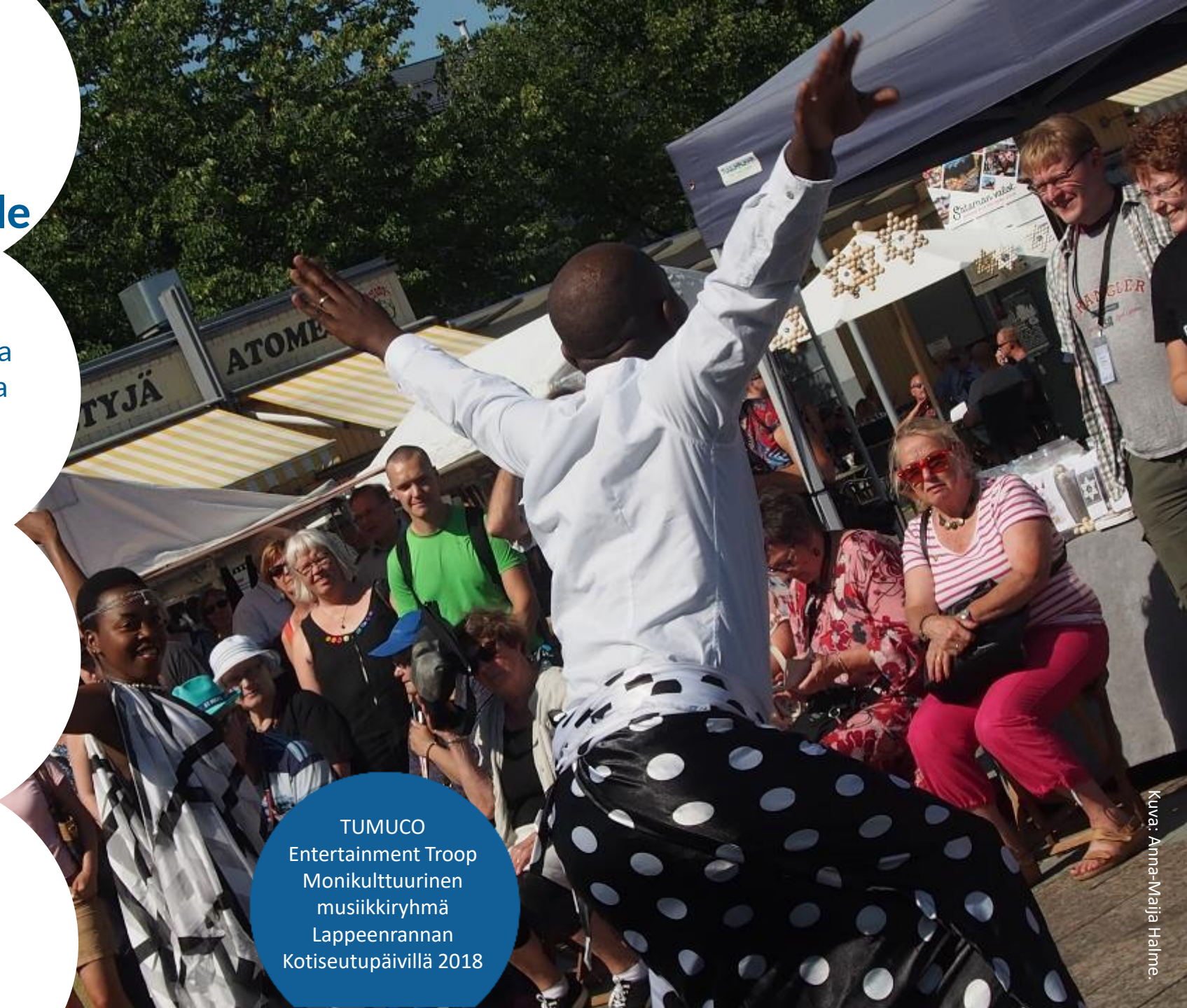
TUMUCO Entertainment Troop Monikulttuurinen musiikkiryhmä Lappeenrannan Kotiseutupäivillä 2018