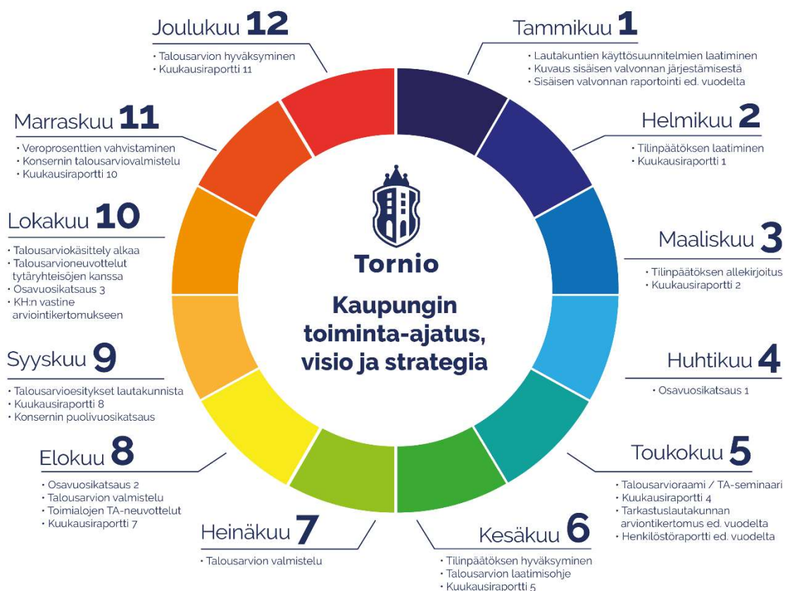
Kuvio 1. Tornion kaupungin talouden ja toimintojen suunnittelun vuosikello. (kuva päivitetty/tj)