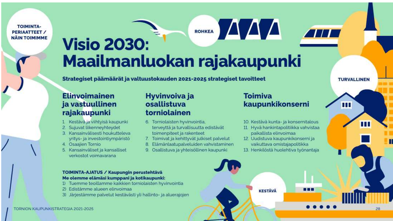
Kuvio 2. Tornion kaupunkistrategia 2021–2025.

Tornion kaupunkistrategiaa tarkistetaan vähintään kerran valtuuston toimikaudessa.