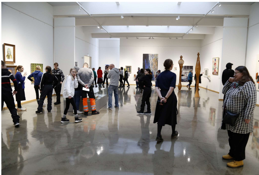
Lähellä-näyttelyn avajaiset 14.2.2024. Paikalla runsaasti nuoria Tornion Työvoimalasätiöstä ja ammattioppilaitos Luovi Tornioista.

kautta. Tavoitteena oli myös tuottaa osallistumisen ja kuulumisen kokemus yhteisen kulttuuriperinnön äärellä sekä tutustuttaa kuvataiteeseen taidemuseokontekstissa.