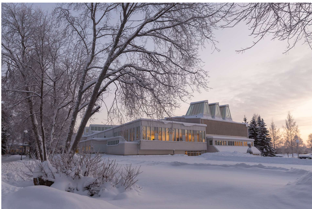
Kuva: Eija Mäki vuoti