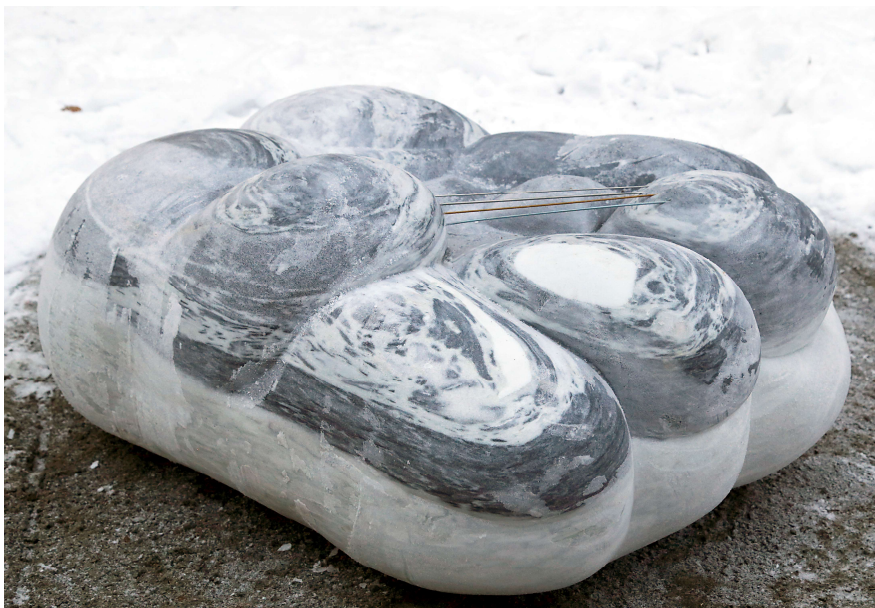
Emma Jääskeläisen teos Cloud Number Nine tuli osaksi taidemuseon ympäristön veistospolkua.