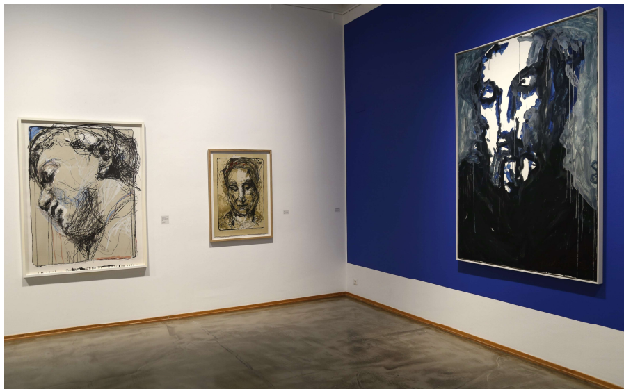
Kuutti Lavosen näyttely esitteli kesällä 2024 taiteilijan tuotantoa yksityiskokoelmista sekä pohjoissuomalaisten taidemuseoiden kokoelmista.