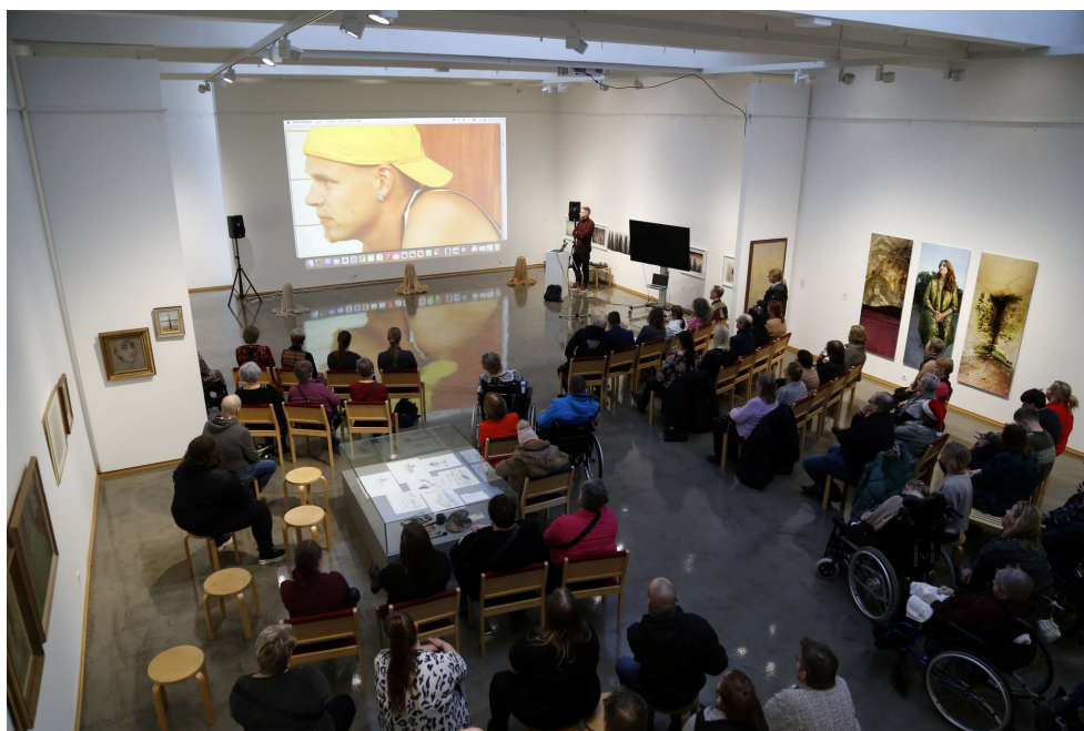
Aineen sali täyttyi osallistujista vammaistenpäivän juhlassa joulukuussa 2024. Juhlapuhetta pitämässä Marko "Signmark" Vuoriheimo.