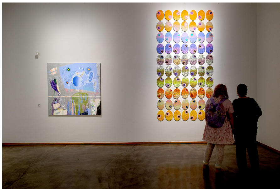
Kirsti Muinosen teokset toivat väriloistoa pimeään syksyyn.

Kirsti Muinosen yksityisnäyttely Piknik toi värikylläisen sukelluksen loka-marraskuun pimeyteen. Näyttely esitteli oululaisen Kirsti Muinosen tuotantoa pitkältä uralta sekä vuonna 2024 valmistuneita, täysin uusia teoksia.