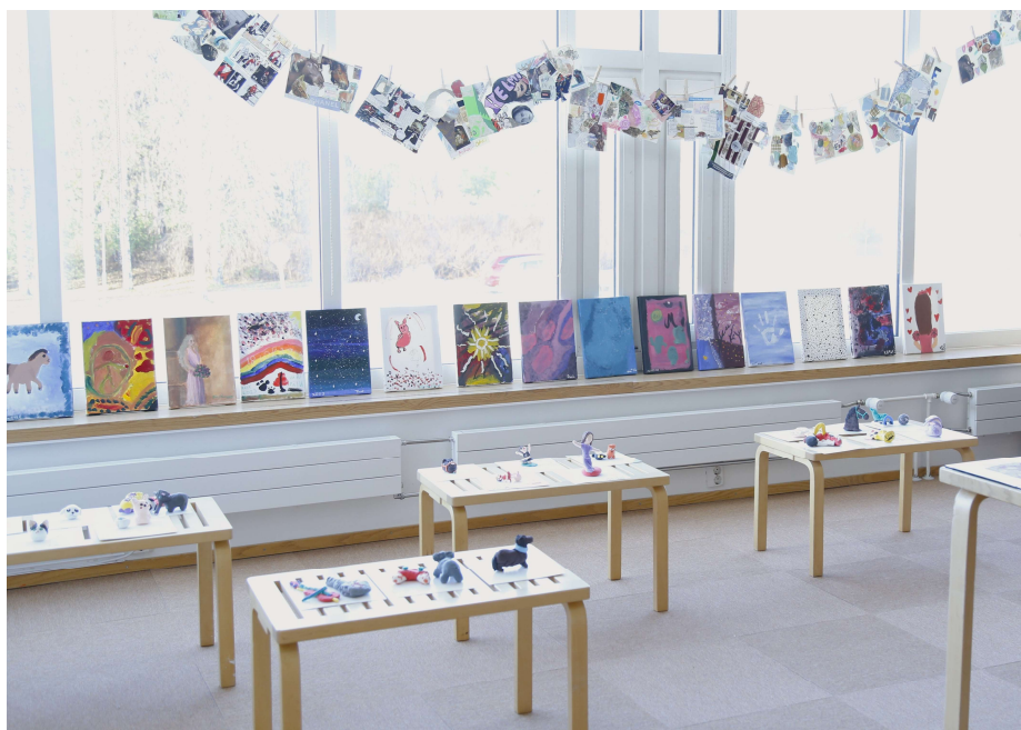
Taideleirin teoksia osallistajat pääsivät esittelemään läheisille järjestetyssä päättäjäisissä.

Taideleiri 5–15-vuotiaille toteutettiin hiihtolomaviikolla päivittäin klo 10–15. Leiriohjelmassa tutustuttiin Aineen taidekokoelmiin, työskenneltiin eri taidetekniikoilla taidekasvatustila Valossa sekä tutustuttiin alueen muuhun kulttuuritarjontaan. Leirin lopuksi järjestettiin leiriläisten tekemistä teoksista näyttely, johon kutsuttiin perhe ja ystävät. Päiväohjelma sisälsi aamu- ja välipalan sekä lounaan. Leirille osallistui 13 lasta. Aineen taidemuseon museopedagoginen henkilöstö suunnitteli ja toteutti leirin. Lisäksi leirillä oli apuna harjoittelija Lapin AMK:sta.