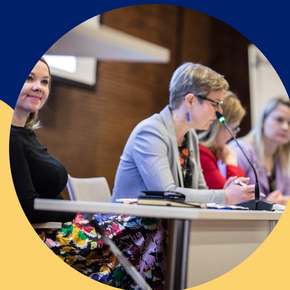
Konserni- ja elinvoimapalvelut