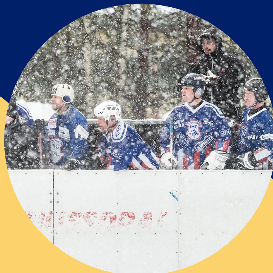
Liikunta- ja kulttuuri-palvelut