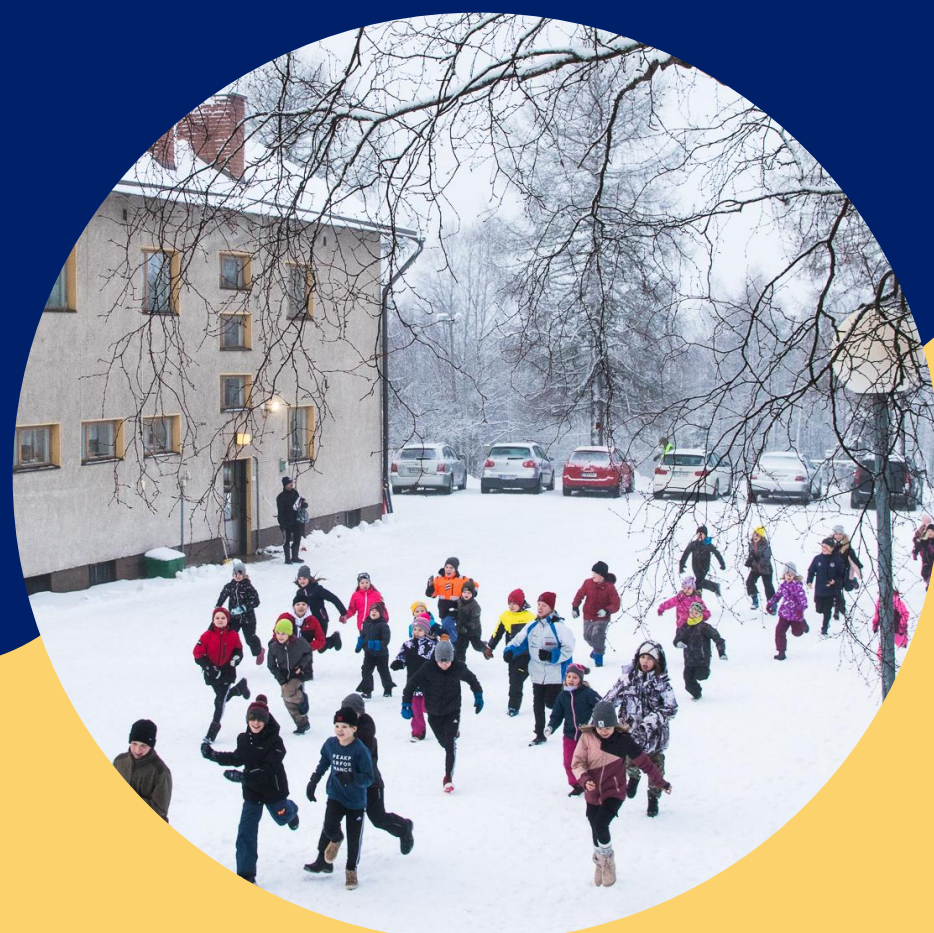
Varhaiskasvatus ja opetus