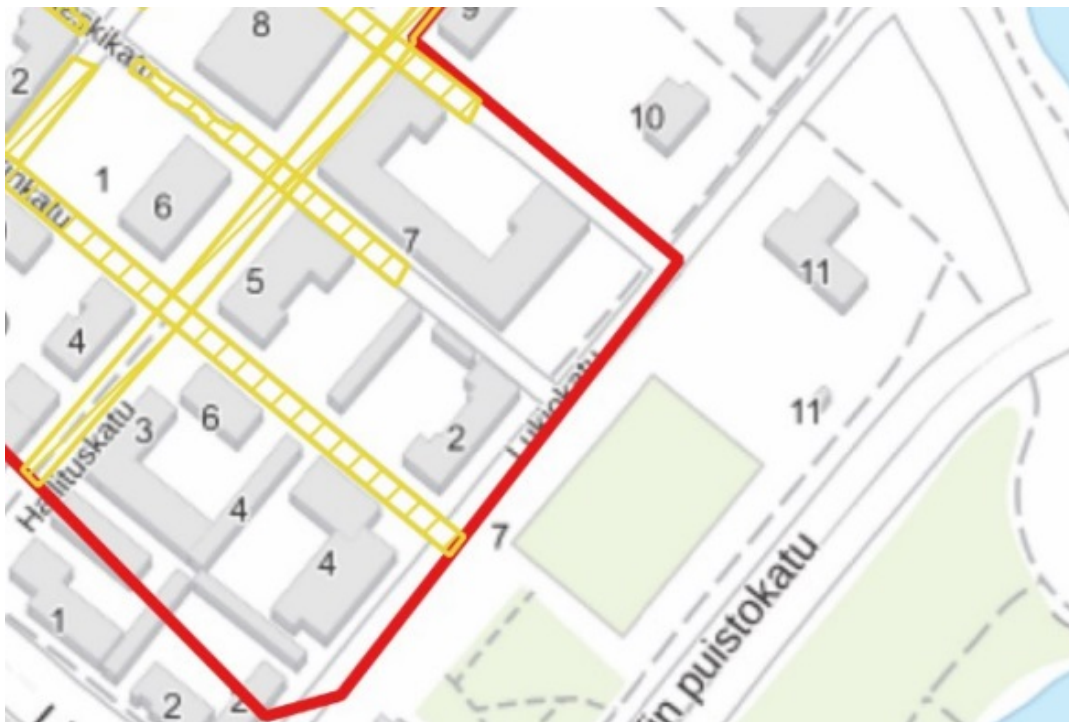
Kuva 2. Lukiokadun katualue on luokiteltu 3. luokkaan (ei väriä).