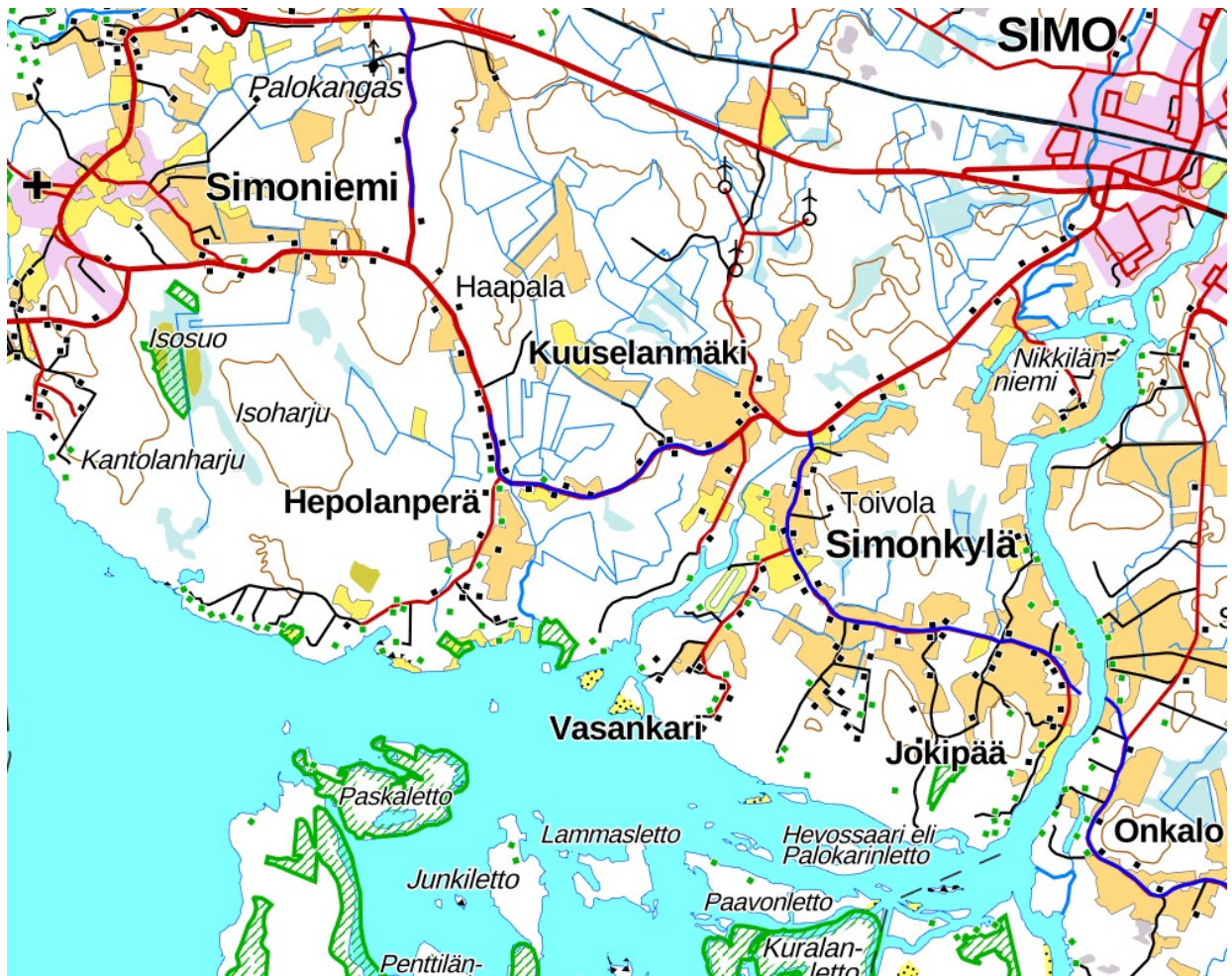
Pohjanmaan rantatien RKY-osuudet Simonkylässä ja Simoniemessä merkittynä karttaan sinisinä tieviivoina.